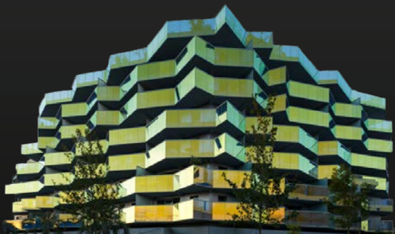
KOH I NOOR | Montpellier (Port Marianne)

Retrouvez nos autres programmes sur www.kalelithos.fr